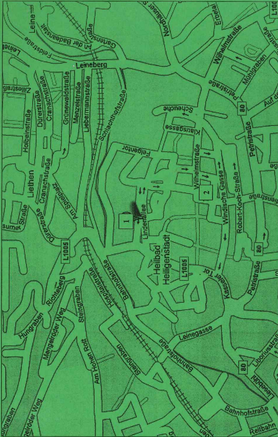
Stadtplan Innenstadt von Heiligenstadt