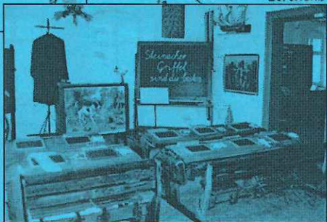
Aufnahme aus dem Schiefermuseum Steinach

(Unterlagen mit freundlicher Unterstützung durch das Fremdenverkehrsbüro Steinach)